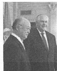
O diretor da agência (e) se encontrou com Tillerson (d) na semana passada e diz confiar na cooperação.

O acordo com o Irã é considerado um dos principais êxitos diplomáticos de Obama.