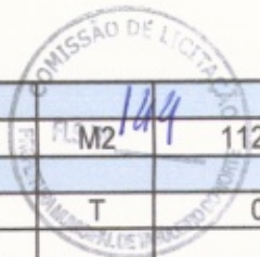
TABULEIRO DO NORTE-CE, MAIO DE 2022